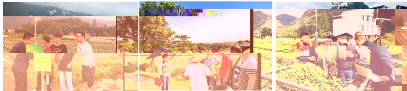
湖北省宜昌市 湖北省宜昌市 湖北省宜昌市